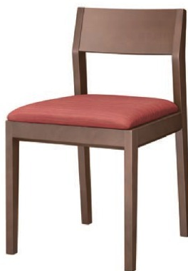
1235 河内 D 椅子