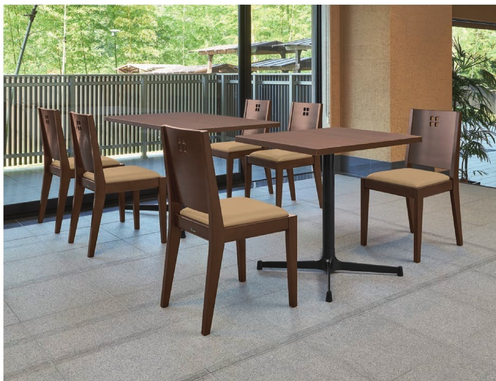
脚部 4318 天板 9215 HX- 大間 D テーブル W1200 × D750 × H700mm / 脚部 4310 天板 9210 HX- 大間 D テーブル W600 × D750 × H700mm 【P141 記載】 張地 / プレザント PL-15 (Aランク)