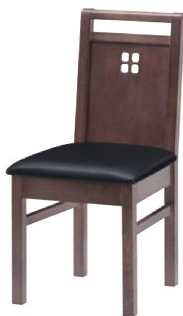
1296-1780-1971 隠岐 D 椅子 張地: 黒レザー (既製品)