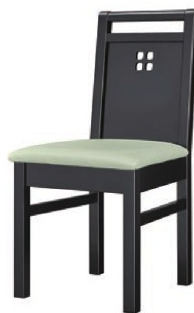
1396-1781 隠岐 B 椅子 張地: マニエラ L-8249 (Bランク)