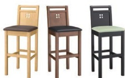
スタンダード椅子は、100 ページをご覧ください。