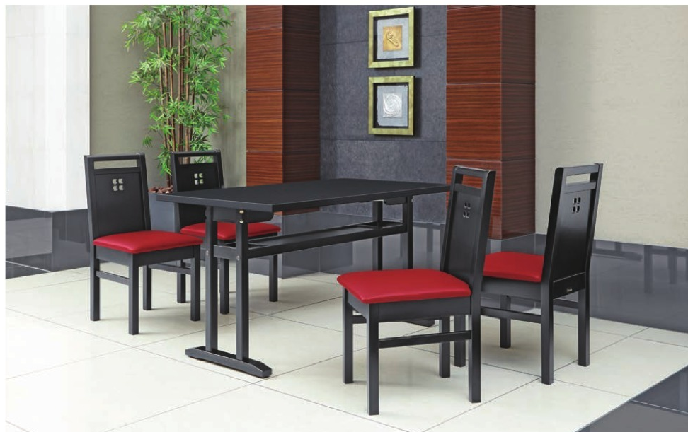
脚部 4720-4726 天板 9225 HLB 棚付-大間B テーブル W1200×D750×H700mm 【P141 記載】