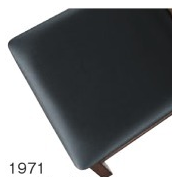
1971 黒レザー (既製品) 張地 / オールマイティール-8671 (シンコール)