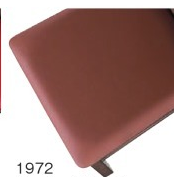
1972 茶レザー (既製品) 張地 / オールマイティール-8669 (シンコール)