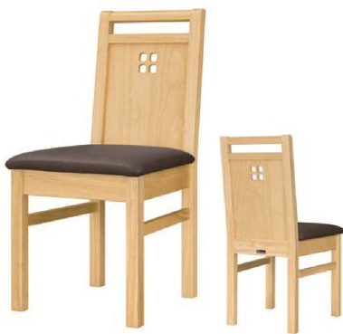
1096-1779 隠岐 N 椅子 張地: 色舞 SH-12 (Bランク)

主 材 / ラバーウッド 塗装色 / N: ナチュラルクリヤ / D: ダークブラウン / B: ブラック