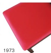
1973 赤レザー (既製品) 張地 / オールマイティール-8698 (シンコール)