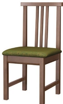
1216 桐竹 D 椅子