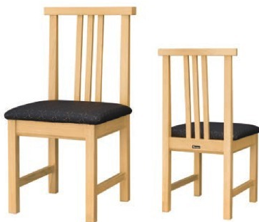
1016 桐竹 N 椅子