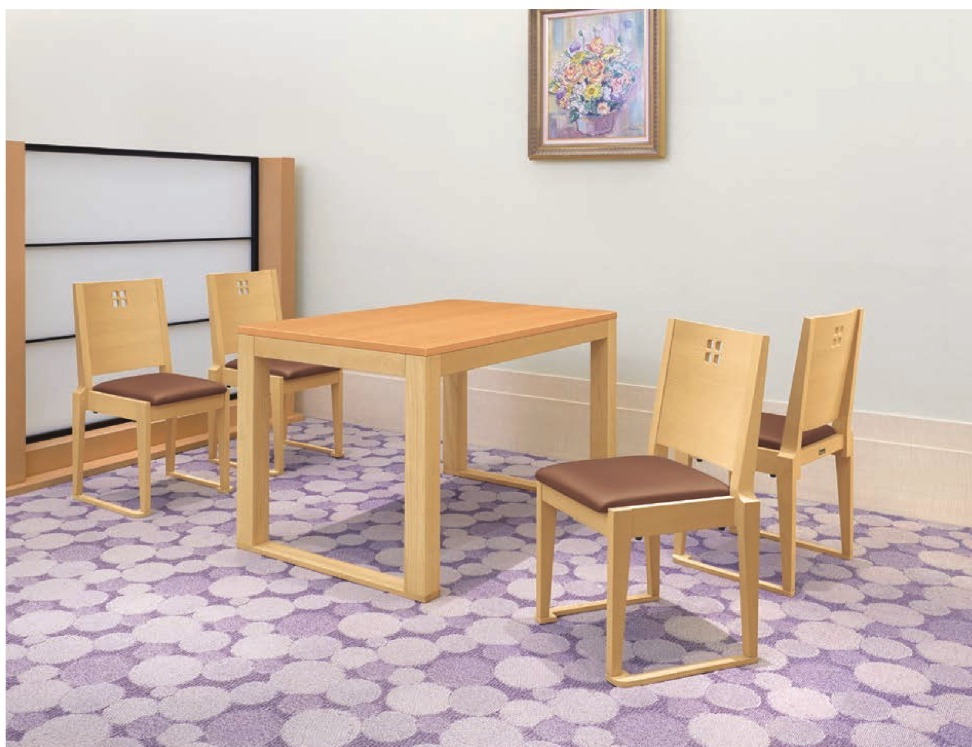
脚部 4370-4970 天板 9908 H 長門I N ソリ付-長門 N テーブル W1200 × D750 × H700 mm 【P134 記載】 張地 / クレンズII L-8532 (Aランク)