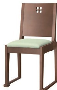
1126 室津 D 椅子