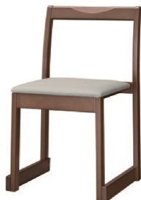
1221-1728 右近 D 椅子 張地 : マニエラ L-8256 (Bランク)