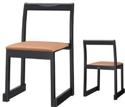
1321-1728 右近 B 椅子 張地 : クレンスII L-8529 (Aランク)

※この椅子は最大5本までスタッキングができます。 ※この椅子は脚をカットしてシート高を変更することができます。 (脚カットは、上代 ¥1,500 UP となります。)