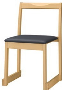
1021-1728 右近 N 椅子 張地 : クレンスII L-8534 (Aランク)