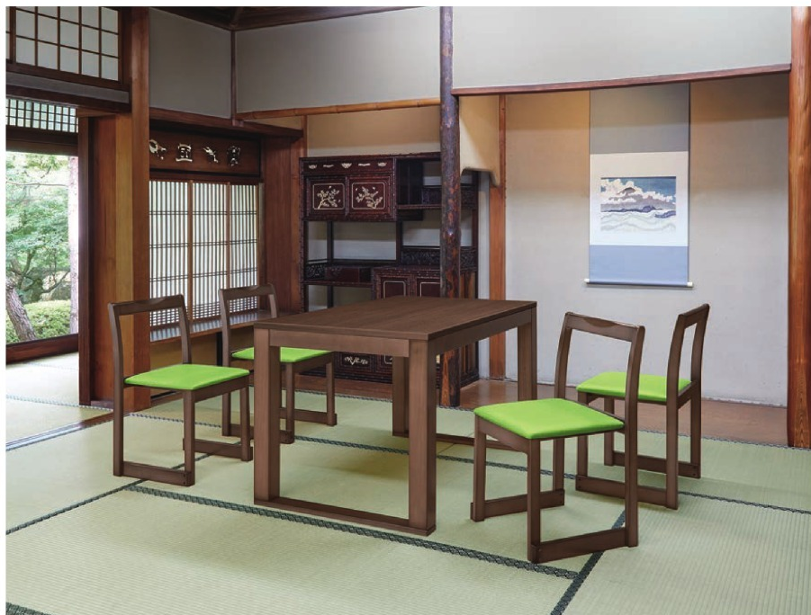
脚部 4380-4980 天板 9938 H 長門I D ソリ付-長門 D テーブル W1200 × D750 × H700 mm 【P134 記載】 張地 / クレンスII L-8514 (Aランク)