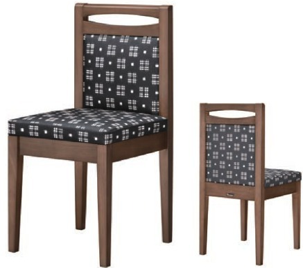
1236-1924 根室 D 椅子 張地: カスリレザー (Aランク)