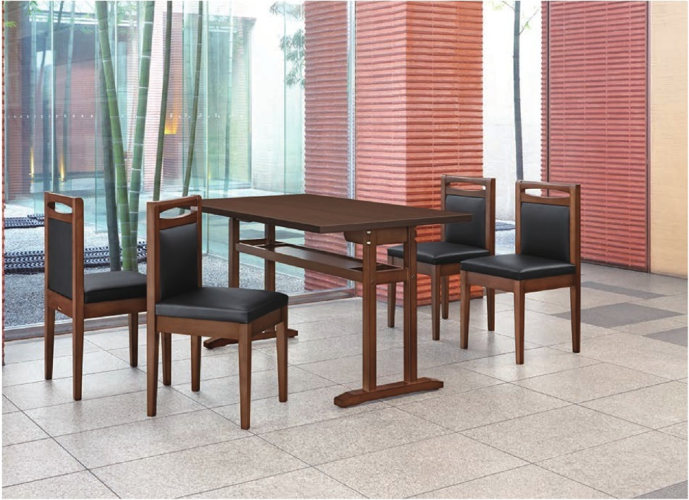
脚部 4710-4716 天板 9215 HLD 欄付一丈間Dテーブル W1200×D750×H700 mm 【P141 記載】 張地/クレンズII L-8534 (Aランク)