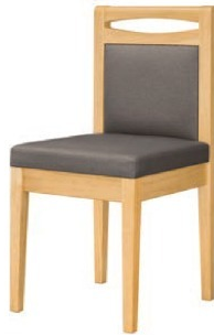
1036-1924 根室 N 椅子 張地: マニエラ L-8262 (Bランク)