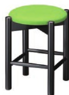
1342-2481 若草 B 椅子 張地: グリーンレザー (既製品)