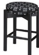
1342-1942 三笠 B 椅子 張地: カスリレザー (既製品)