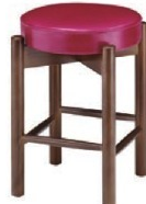
1242-1949 三笠 D 椅子 張地: 赤レザー (既製品)