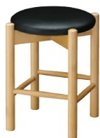
1042-2470 若草 N 椅子 張地: ブラックレザー (既製品)