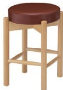
1042-1945 三笠 N 椅子 張地: 茶レザー (既製品)