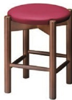
1242-2480 若草 D 椅子 張地: エンジレザー (既製品)