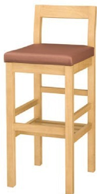
2018 吉野 N スタンド椅子 張地 : マニエラ L-8275 (Bランク)

主 材 / ラバーウッド 塗装色 / N : ナチュラルクリヤ / D : ダークブラウン / B : ブラック