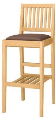
2030 那須 N スタンド椅子 張地: マニエラ L-8276 (Bランク)