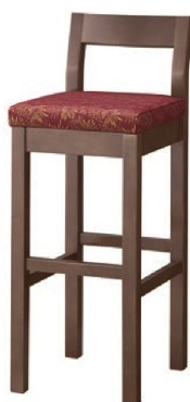
2166 小町 D スタンド椅子 張地: 松葉 L UP-1000 (Cランク)