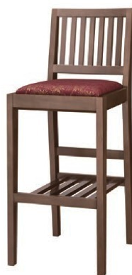
2230 那須 D スタンド椅子 張地: 松葉 L UP-1000 (Cランク)