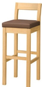
2066 小町 N スタンド椅子 張地: マニエラ L-8276 (Bランク)