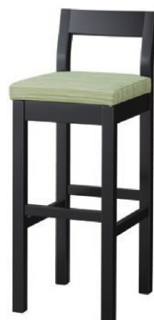
2266 小町 B スタンド椅子 張地: デコア L-8148 (Bランク)

椅子は、031 ページをご覧ください。カウンター椅子は、127 ページをご覧ください。