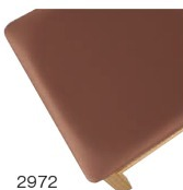
2972 茶レザー (既製品) 張地: オールマイティー L-8669 (シンコール)