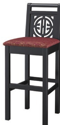
2396-2776 周荘 B スタンド椅子 張地: 松葉 L UP-1000 (Cランク)