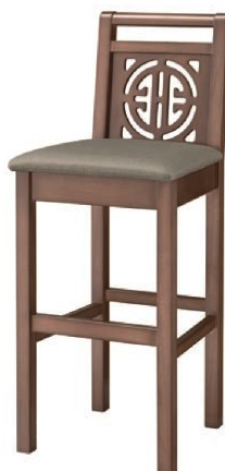
2296-2775 周荘 D スタンド椅子 張地: マニエラ L-8262 (Bランク)