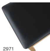
2971 黒レザー (既製品) 張地: オールマイティー L-8671 (シンコール)