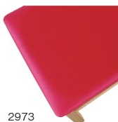
2973 赤レザー (既製品) 張地: オールマイティー L-8698 (シンコール)