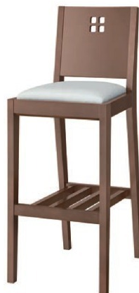
2149 空 D スタンド椅子 張地: シルキーラスタル UP-763 (Bランク)