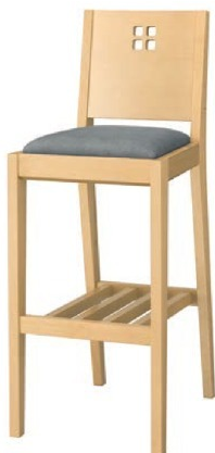
2049 空 N スタンド椅子 張地: デニム II UP-873 (Bランク)