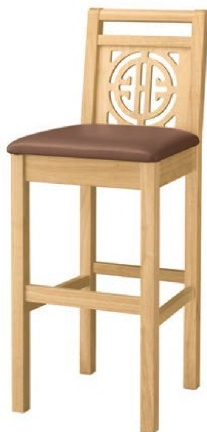
2096-2774-2972 周荘 N スタンド椅子 張地: 茶レザー (既製品)