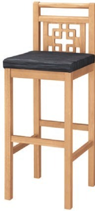
2040-2685 青島 N スタンド椅子 張地：デコア L-8151 (Bランク)