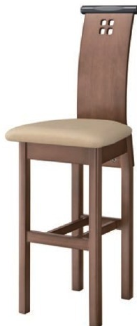
2129-1787 夕風 D スタンド椅子 張地：マニエラ L-8258 (Bランク)