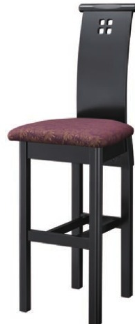
2329-1788 夕風 B スタンド椅子 張地：松葉 L UP-1001 (Cランク)