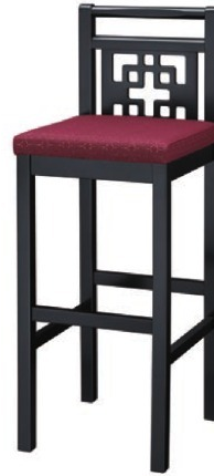
2340-2687 青島 B スタンド椅子 張地：麻葉襲 UP-995 (Cランク)