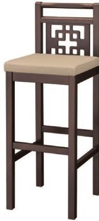
2140-2686 青島 D スタンド椅子 張地：マニエラ L-8258 (Bランク)