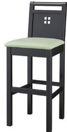
2396-2781 隠岐 B スタンド椅子 張地: マニエラ L-8249 (Bランク)