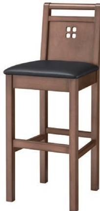
2296-2780-2971 隠岐 D スタンド椅子 張地: 既製品 (黒レザー)