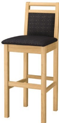
2096-2925 対馬 N スタンド椅子 張地: 麻葉葉 UP-997 (Cランク)