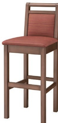
2296-2925 対馬 D スタンド椅子 張地: デコア L-8145 (Bランク)