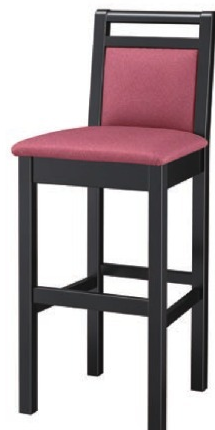
2396-2925 対馬 B スタンド椅子 張地: 色舞 SH-10 (Bランク)