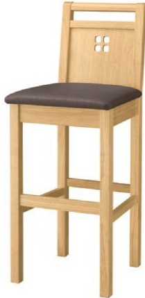
2096-2779 隠岐 N スタンド椅子 張地: 色舞 SH-12 (Bランク)