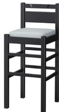
2355 阿山 B スタンド椅子 張地: シルキーラスタルUP-763 (Bランク)