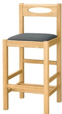
2032 室生 N スタンド椅子 張地: デニム II UP-873 (Bランク)

脚カットは、上代 1,500円 UPとなります。 (SH-510までカット可能)