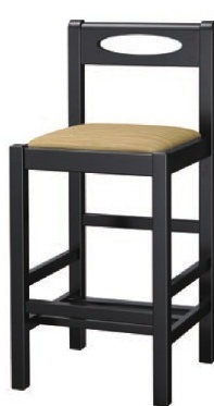
2232 室生 B スタンド椅子 張地: デコア L-8149 (Bランク)