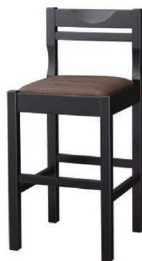
2306 関羽 B スタンド椅子 張地: デコア L-8150 (Bランク)