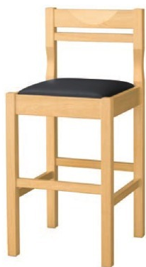
2006-1899 関羽 N スタンド椅子 張地: 黒レザー (既製品)

脚カットは、上代 1,500円 UPとなります。 (SH-440までカット可能)