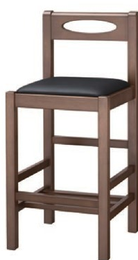
2132-1899 室生 D スタンド椅子 張地: 黒レザー (既製品)