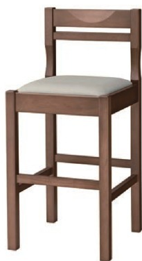
2206 関羽 D スタンド椅子 張地: マニエラ L-8256 (Bランク)