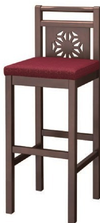
2140-2676 飛鳥 D スタンド椅子 張地：麻葉襲 UP-995 (Cランク)