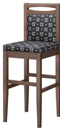
2236-1924 根室 D スタンド椅子 張地：カスリレザー (Aランク)