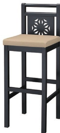
2340-2677 飛鳥 B スタンド椅子 張地：マニエラ L-8258 (Bランク)