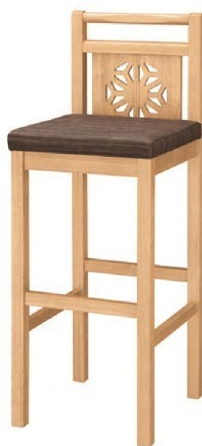
2040-2675 飛鳥 N スタンド椅子 張地：デコア L-8150 (Bランク)