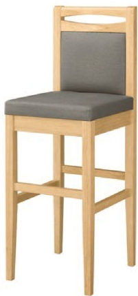
2036-1924 根室 N スタンド椅子 張地：マニエラ L-8262 (Bランク)