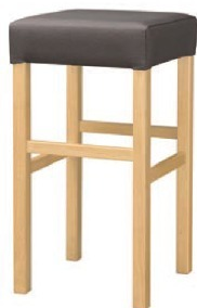
2033 保津 N スタンド椅子 張地: マニエラ L-8262 (Bランク)

脚カットは、上代 1,500円 UPとなります。 (SH-430までカット可能)