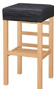
2054 宮滝 N スタンド椅子 張地: デコア L-8151 (Bランク)

脚カットは、上代 1,500円 UPとなります。 (SH-480までカット可能)