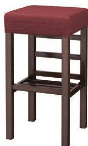
2154 宮滝 D スタンド椅子 張地: デコア L-8145 (Bランク)