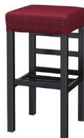
2354 宮滝 B スタンド椅子 張地: 麻葉髯 UP-995 (Cランク)