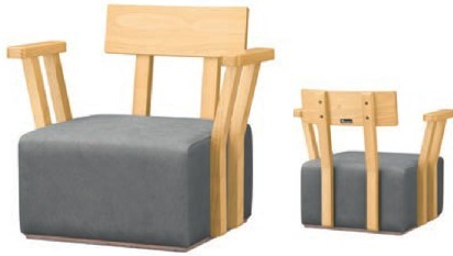
1888-1961 玄海 N 座椅子 1530 玄海 IN 背もたれ 1540×2 玄海 N アーム×2 張地：デニムⅡ UP-873 (Bランク)