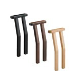
玄海 アーム (左右兼用) 1540 玄海 N アーム 1541 玄海 D アーム 1542 玄海 B アーム ¥5,300