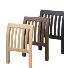
玄海Ⅱ 背もたれ 1520 玄海Ⅱ N 背もたれ 1521 玄海Ⅱ D 背もたれ 1522 玄海Ⅱ B 背もたれ ¥12,700

椅子は、53ページをご覧ください。 スタンド椅子は、106ページをご覧ください。