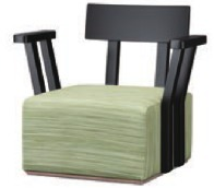
1888-1961 玄海 B 座椅子 1532 玄海 IB 背もたれ 1542×2 玄海 B アーム×2 張地：デコア L-8148 (Bランク)