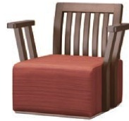
1888-1961 玄海 D 座椅子 1521 玄海ⅡD 背もたれ 1541×2 玄海 D アーム×2 張地：デコア L-8145 (Bランク)