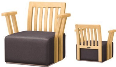
1888-1961 玄海 N 座椅子 1520 玄海ⅡN 背もたれ 1540×2 玄海 N アーム×2 張地：色舞 SH-12 (Bランク)