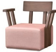
1888-1961 玄海 D 座椅子 1531 玄海 ID 背もたれ 1541×2 玄海 D アーム×2 張地：シルキーラスタルUP-773 (Bランク)