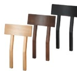
玄海Ⅰ 背もたれ 1530 玄海Ⅰ N 背もたれ 1531 玄海Ⅰ D 背もたれ 1532 玄海Ⅰ B 背もたれ ¥7,200