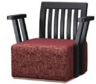
1888-1961 玄海 B 座椅子 1522 玄海ⅡB 背もたれ 1542×2 玄海 B アーム×2 張地：松葉 L UP-1000 (Cランク)