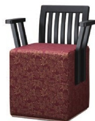
1888-1960 周防 B 座椅子 1522 周防ⅡB 背もたれ 1542×2 周防 B アーム×2 張地：松葉 L UP-1000 (Cランク)