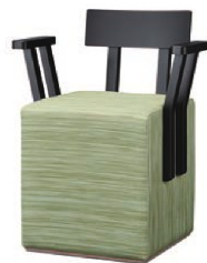
1888-1960 周防 B 座椅子 1532 周防 IB 背もたれ 1542×2 周防 B アーム×2 張地：デコア L-8148 (Bランク)