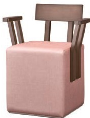
1888-1960 周防 D 座椅子 1531 周防 ID 背もたれ 1541×2 周防 D アーム×2 張地：シルーラスタル UP-773 (Bランク)