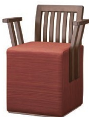
1888-1960 周防 D 座椅子 1521 周防ⅡD 背もたれ 1541×2 周防 D アーム×2 張地：デコア L-8145 (Bランク)