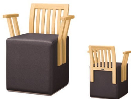
1888-1960 周防 N 座椅子 1520 周防ⅡN 背もたれ 1540×2 周防 N アーム×2 張地：色舞 SH-12 (Bランク)