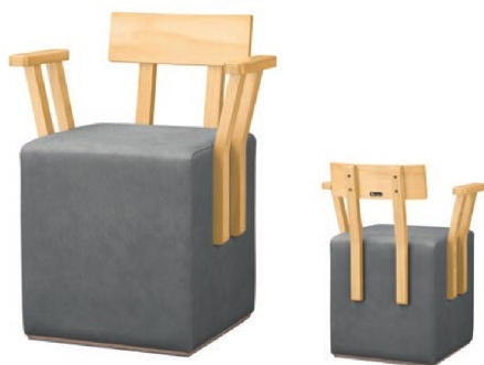
1888-1960 周防 N 座椅子 1530 周防 IN 背もたれ 1540×2 周防 N アーム×2 張地：デニムⅡ UP-873 (Bランク)