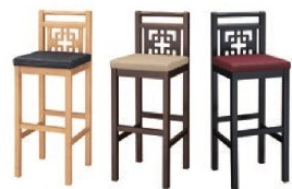
スタンド椅子は、99 ページをご覧ください。