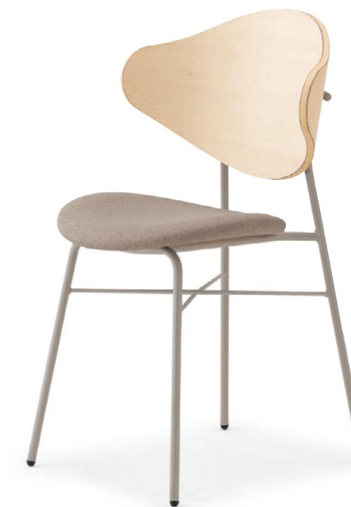
ナプアW2 SI-ML ¥40,600 表材:レザー-C38 (No.5)

◀ナプアM1GL-MX ¥37,200 テーブル:TB2923-YJ-DB (P341)