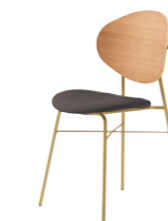
2 GL-MN レザー-C38 (No.13)