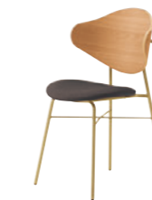
2 GL-MN レザー-C38 (No.13)