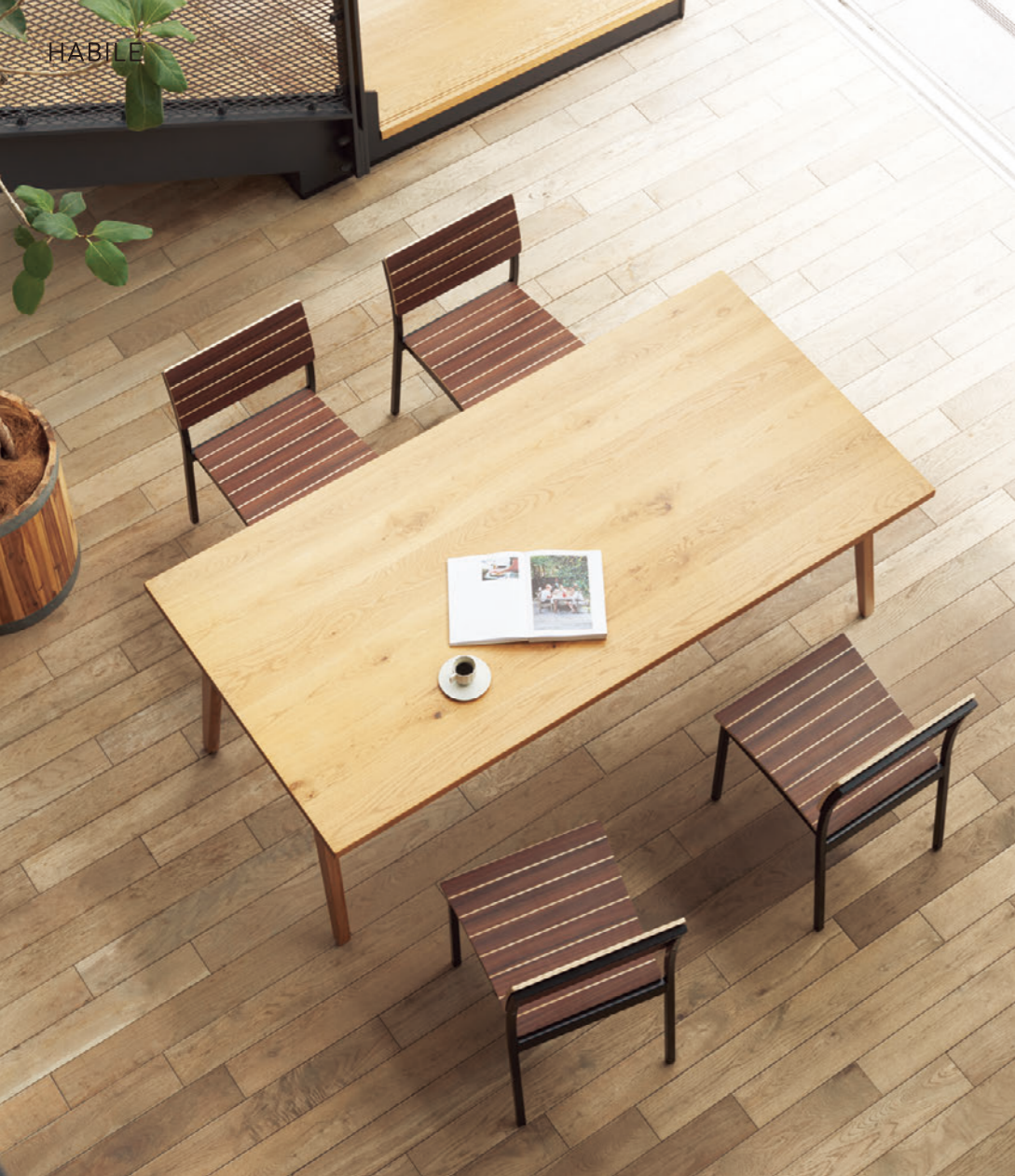
▲アビル MX ¥35,500 テーブル:TB3023-YJ-NA (P325)