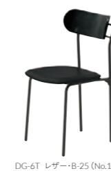
DG-6T レザー-B-25 (No.10)

脚カット最大寸法: 40mm >>P400 脚端パーツ: 取付可能 >>P400