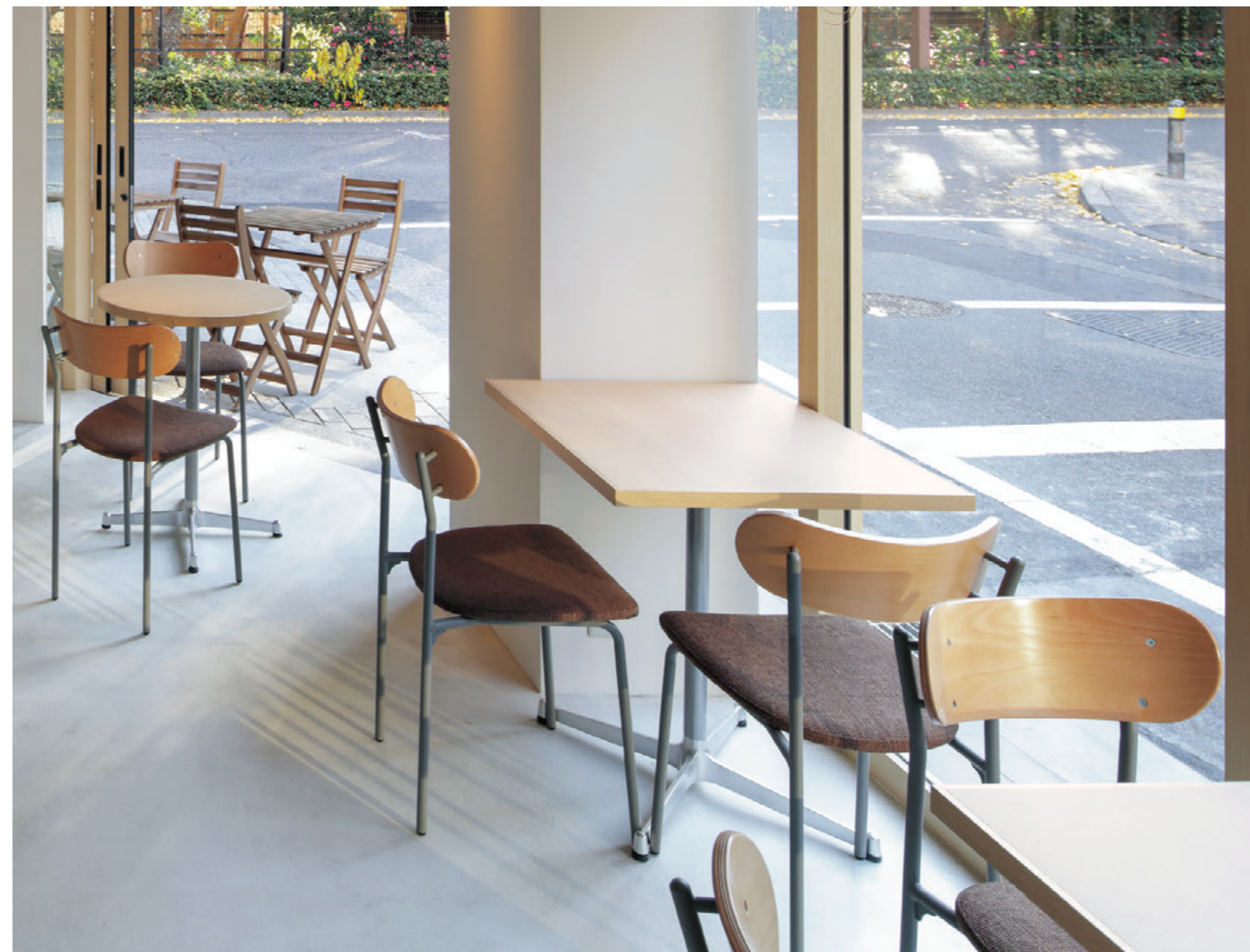
▲コトル SI-5N ¥39,800 張材:布地・D-54 (ブラウン)