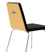
CR-5N レザー-C.22 (No.6)