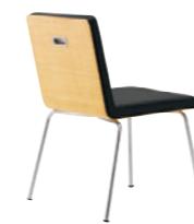
CR-5N レザー-C.22 (No.6)