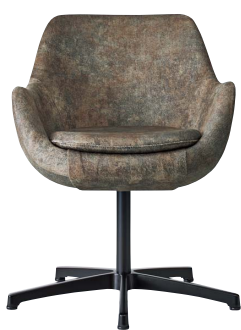
ブルーフェイスA 21774-A D/布・ロモン2 脚部：アルミ合金クロ塗装・AJ付 受座：回転式 ※受座に上下機能は、付属しません。