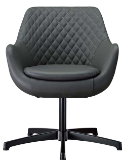
ブルーフェイスB 21775-A C/レザー・ゼラファイト・プロL-8099