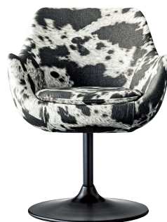
ブルーフェイスC 21835-A ランク外/レザー・ウィクリー1 ¥90,600 脚部：クロ塗装 受座：回転式 ※受座に上下機能は、付属しません。