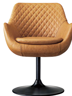
ブルーフェイスD 21836-A B/レザー・パロン01