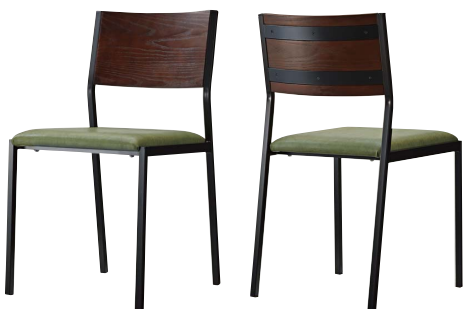
テーマイスBL2 21782-A B/レザー・パロン05