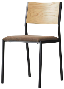
テーマイスBL1 21781-A F/布・マレンコT-9327