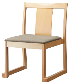
錦イスA (白木) 50552-A D/布・エイガT-9202

お好みに合わせて、背板塗装 (A) と背張り (B) から お選びいただけます。