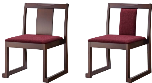
錦イスA (茶) 50553-A E/布・ベベル6