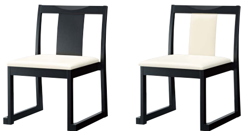
錦イスA (黒) 50554-A A/レザー・メトロ350