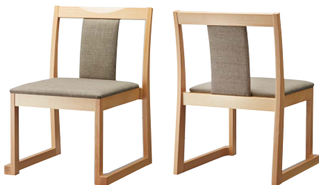
錦イスB (白木) 50555-A