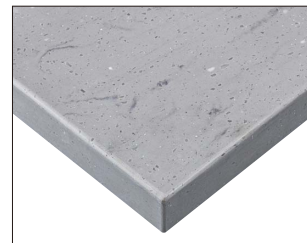
ST-993 (CN) 天板:人工大理石

コンクリートの雰囲気をも人工大理石で再現。 実用性はもちろん、リアルな表情に仕上げました。