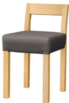
1065 小百合 N 椅子 張地 : マニエラ L-8262 (Bランク)