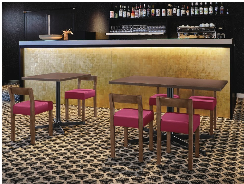
脚部 4310 天板 9210 HX- 大間 D テーブル W600 × D750 × H700mm / 脚部 4318 天板 9215 HX- 大間 D テーブル W1200 × D750 × H700 【P141 記載】 張地 / クレンスII L-8541 (Aランク)