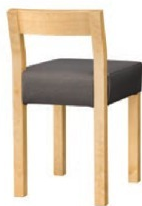
1165 小百合 D 椅子 張地 : 松葉 L UP-1002 (Cランク)