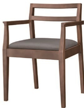
1176 伊東 D アーム椅子