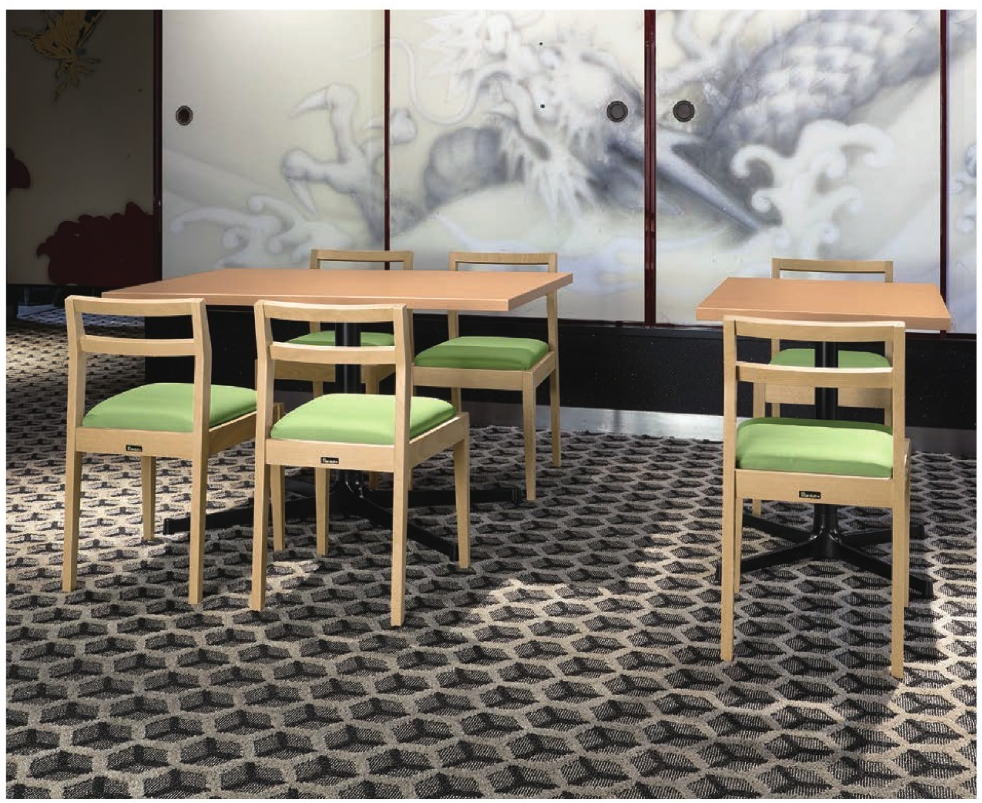
脚部 4318 天板 9305 HX- 太子Nテーブル W1200 × D750 × H700mm / 脚部 4310 天板 9300 HX- 太子Nテーブル W600 × D750 × H700mm 【P140 記載】 張地 / プレザント PL-61 (Aランク)