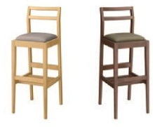
1175 伊東 D 椅子 張地: デニム II UP-872 (Bランク)