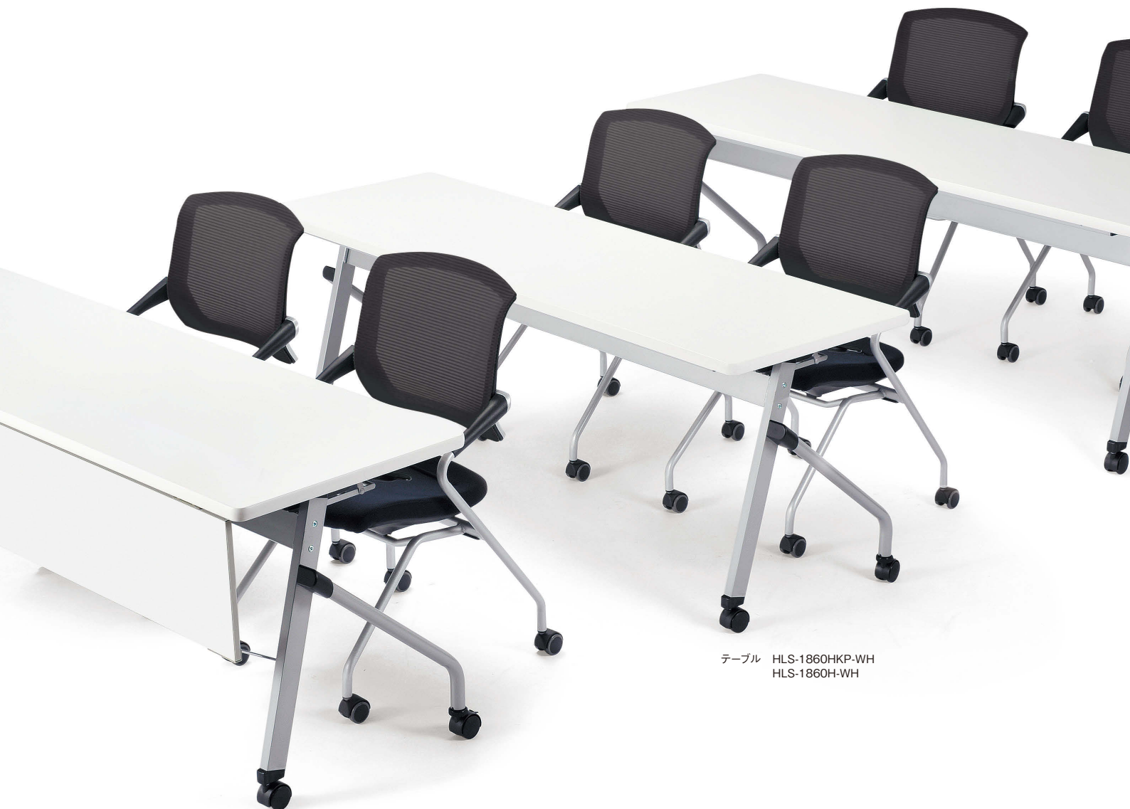
テーブル HLS-1860HKP-WH HLS-1860H-WH