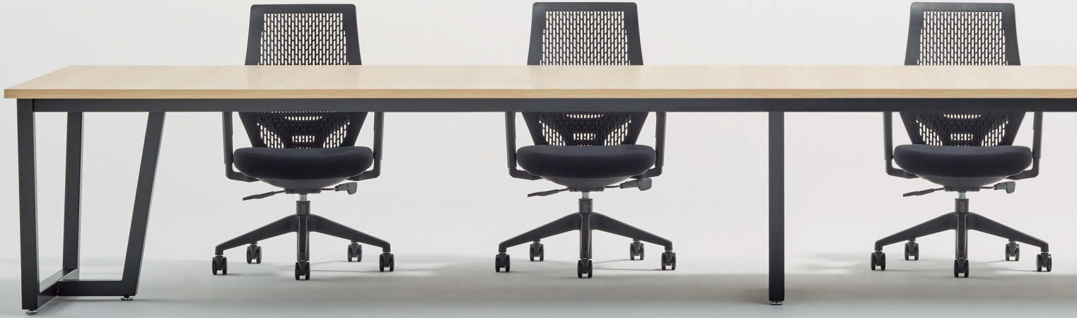
テーブル JP-B4812-LO チェア YC-200BB-BK(P.238)