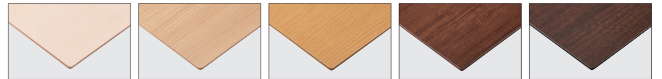
TP-193T TOP / TJY 2080K TP-193C TOP / JC-2016K TP-193N TOP / AY-1021KG TP-193K TOP / TJ-2031KQ98 TP-193D TOP / TJ-301KQ98