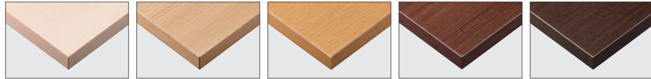
TP-190T TOP / TJY 2080K TP-190C TOP / JC-2016K TP-190N TOP / AY-1021KG TP-190K TOP / TJ-2031KQ98 TP-190D TOP / TJ-301KQ98