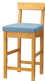
ナチュラル 張地: レザー・ヘリング・LB(B)