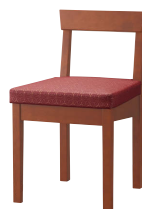
ブラウン 張地: レザー・麻葉繫・UP5473(C)