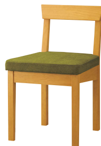
ナチュラル 張地: 布・カプリス・8(D)