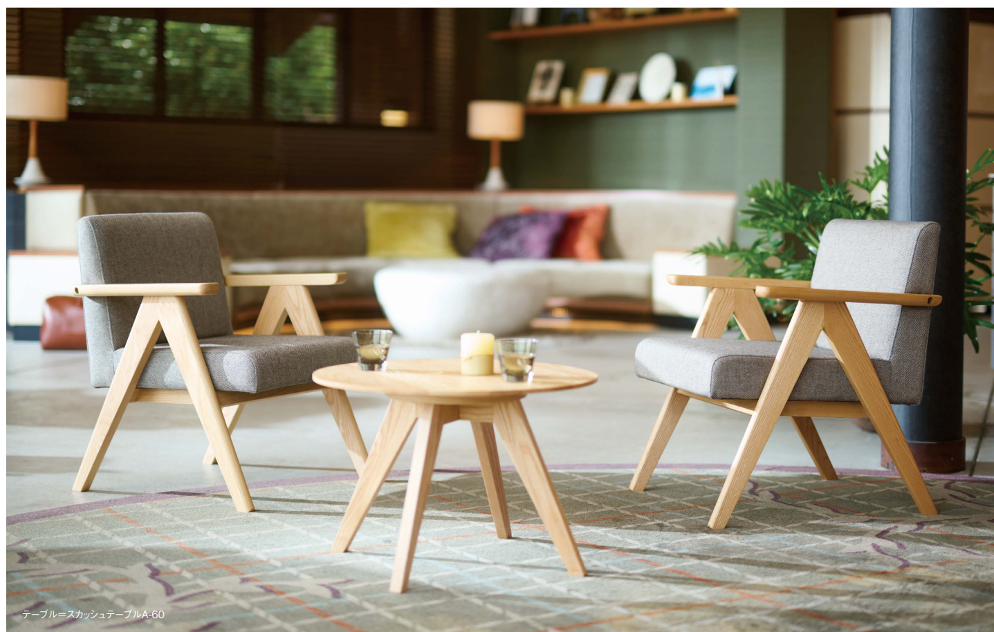
テーブル=スカッシュテーブルA.60