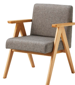
張地: 布・トラッド・TR-2001 (E) ¥78,200