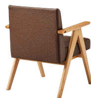
張地: レザー・カフェフォルテ・モコモW・L-6833 (B) ¥71,900