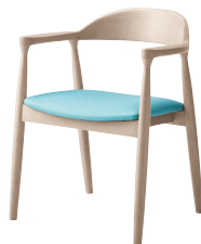
グレイジュ 張地: レザー・マニエラ・L-6362(B) ¥44,000