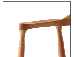
肘の先端に丸みをもたせてにぎり易くしています。