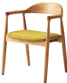
ナチュラル 張地: 布・リボン・RB-342(E) ¥47,000