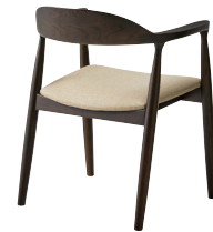
ブラックウォッシュ 張地: レザー・オクタビア・L-6254(B) ¥44,000