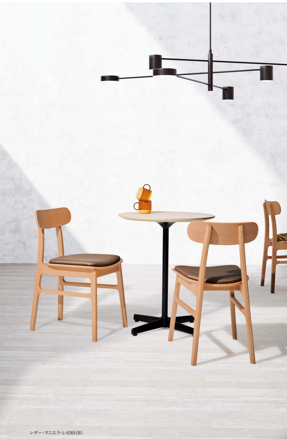
レザー・マニエラ・L-6365 (B)