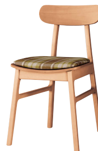
ナチュラル 張地: 布・シグネイチャー・T-9226 (C) ¥29,600