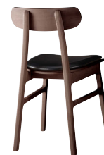
ダークブラウン 張地: レザー・オールマイティー・L-6562 (A) ¥28,000