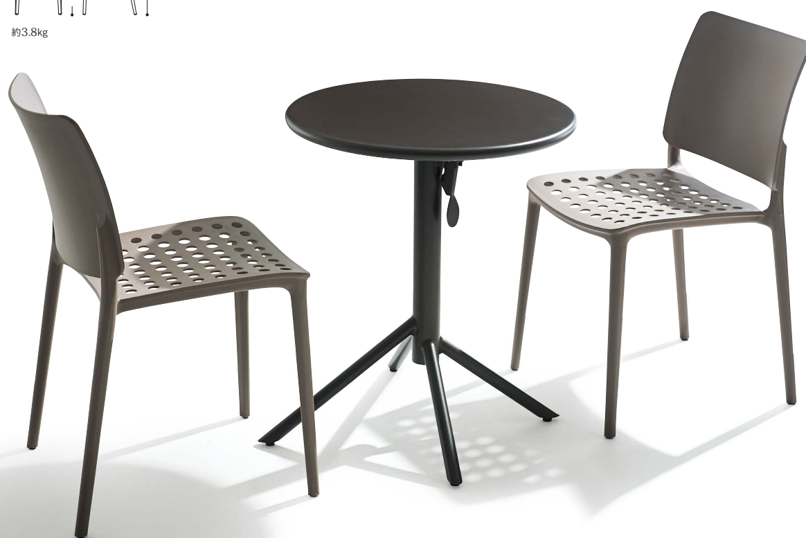
テーブル=ラスティテーブル2型