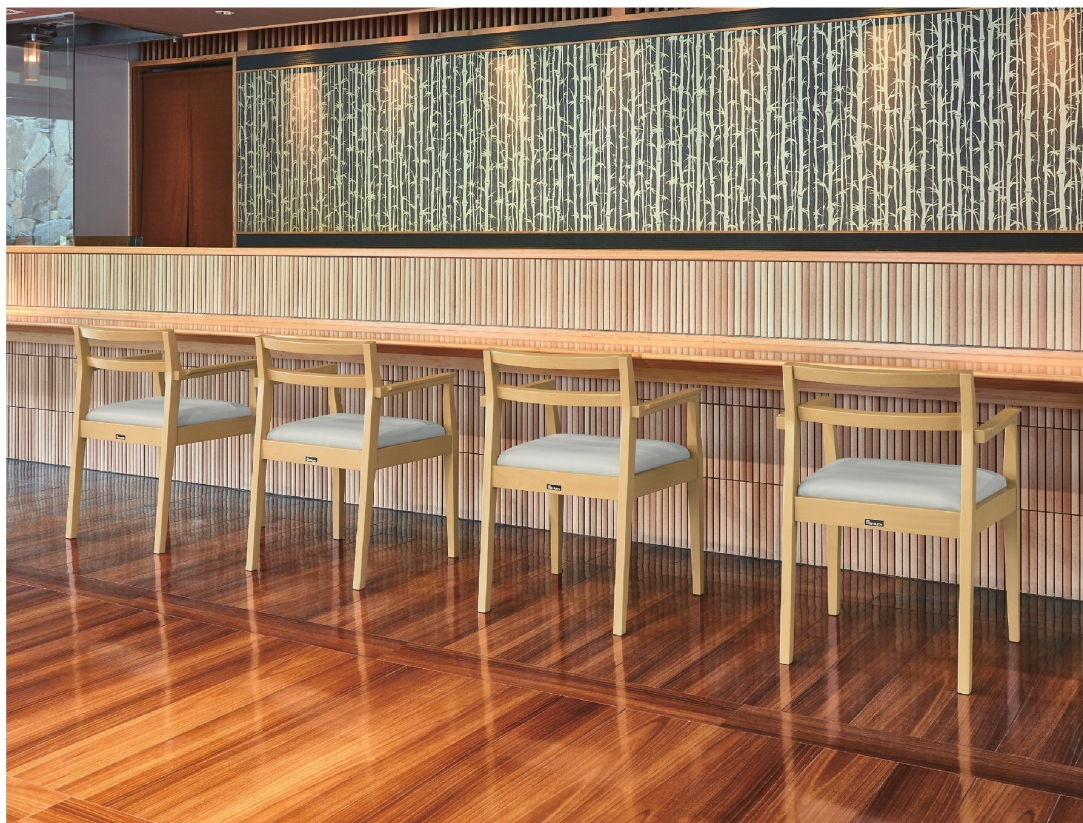
張地 / カラーレザー UP-5017 (A)