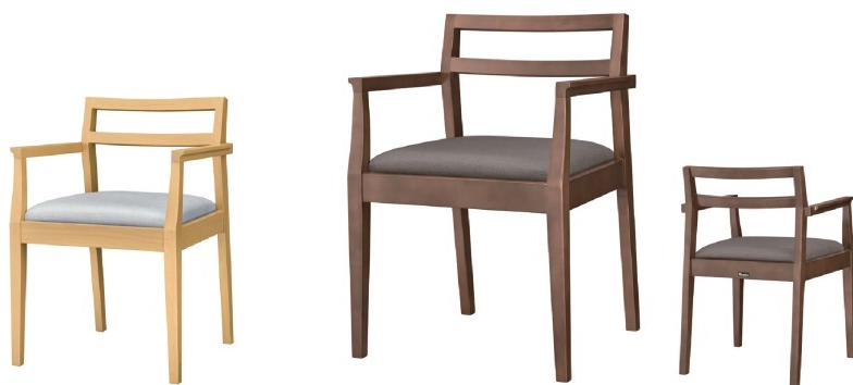
1076 伊東Nアーム椅子 張地：シルキーラスタルUP-5234 (B)