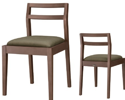
1175 伊東 D 椅子 張地: デニムII UP-5376 (C)