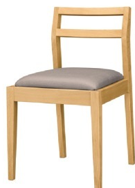
1075 伊東 N 椅子 張地: シルキーラスタル UP-5243 (B)