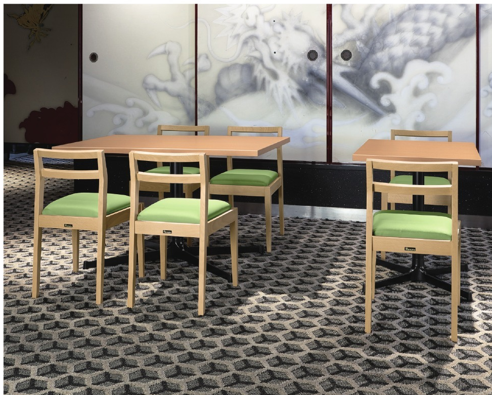
脚部 4318 天板 9305 HX- 太子Nテーブル W1200 × D750 × H700mm / 脚部 4310 天板 9300 HX- 太子Nテーブル W600 × D750 × H700mm 【P112 記載】 張地 / プレザント PL-61 (A)