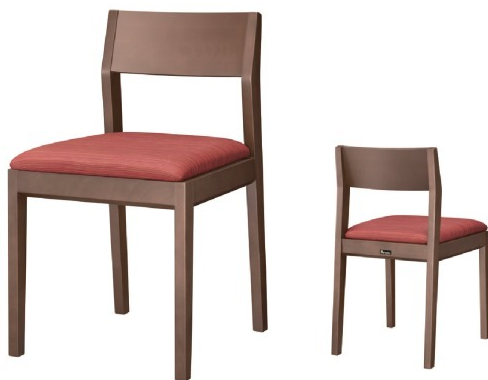
1235 河内 D 椅子 張地 : デコア L-6315 (C)