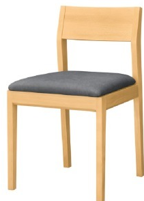
1035 河内 N 椅子 張地 : デニムII UP-5378 (C)