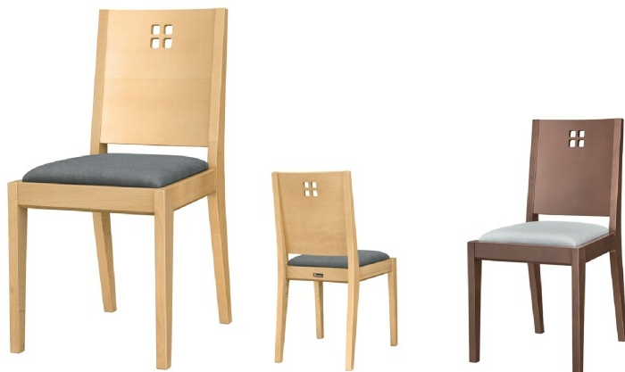
1049 空N椅子 張地：デニムII UP-5378 (C)