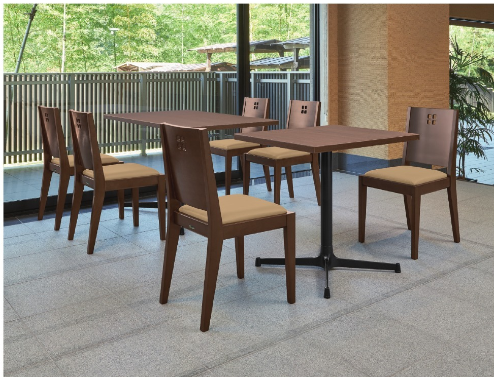
脚部 4318 天板 9215 HX-大間Dテーブル W1200×D750×H700mm/ 脚部 4310 天板 9210 HX-大間Dテーブル W600×D750×H700mm 【P113 記載】 張地 / プレザント PL-15 (A)