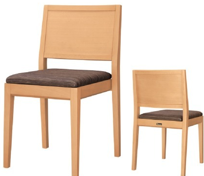
1060 赤阪 N 椅子 張地: デコア L-6320 (C)