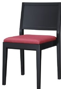
1360 赤阪 B 椅子 張地: 色舞 SH-10 (B)