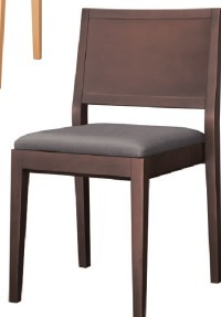
1160 赤阪 D 椅子 張地: マニエラ L-6353 (C)