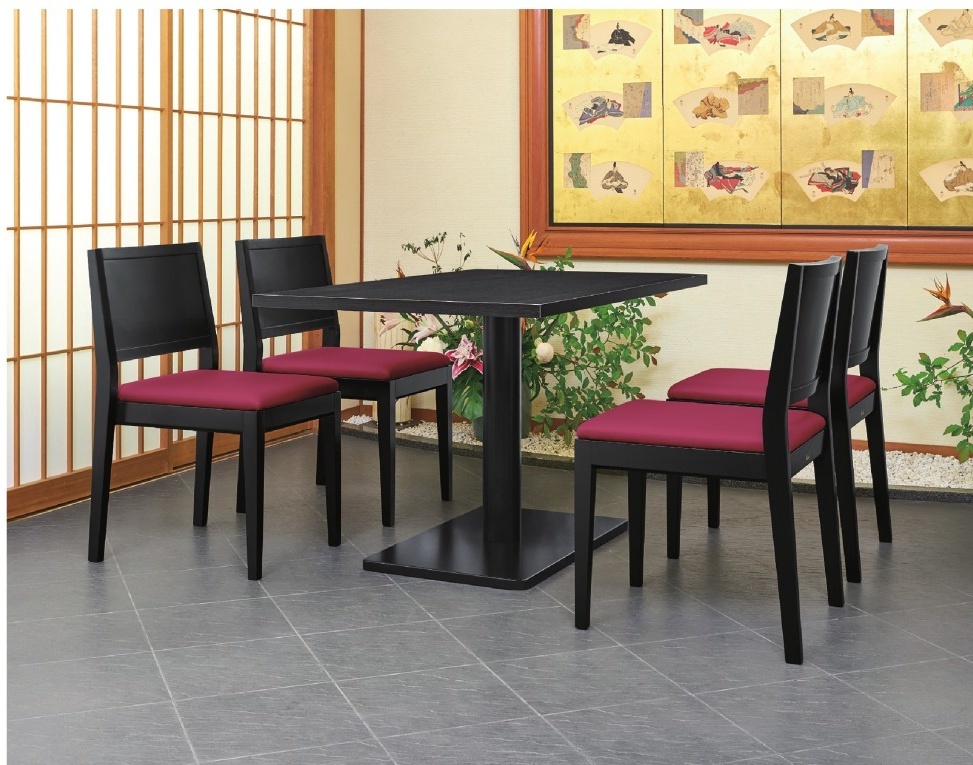
脚部 4208 天板 9325 HD-太子 B テーブル W1200 × D750 × H700 mm 【P112 記載】 張地/プレザント PL-11 (A)