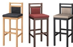
1340-1655 矢吹 B 椅子 張地: シルキーラスタル UP-5243 (B)