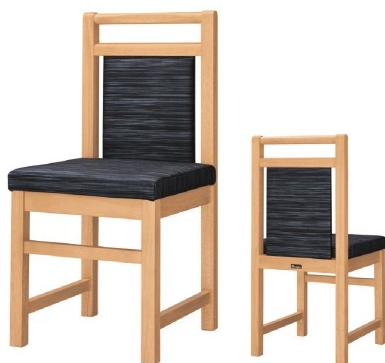
1040-1655 矢吹 N 椅子 張地: デコア L-6321 (C)