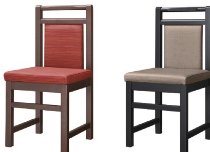
1140-1655 矢吹 D 椅子 張地: デコア L-6315 (C)