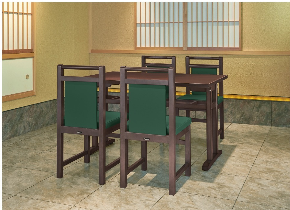
脚部 4710-4716 天板 9215 HLD 棚付一丈間 D テーブル W1200 × D750 × H700 mm 【P113 記載】 張地 / クレンズ II L-6694 (A)