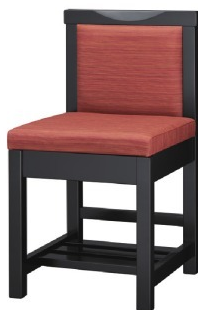
1310-1905 宇陀 B 椅子 張地：デコア L-6315 (C)