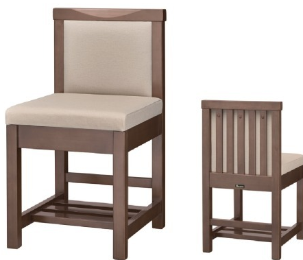
1210-1905 宇陀 D 椅子 張地：マニエラ L-6359 (C)