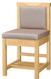
1010-1905 宇陀 N 椅子 張地：シルキーラスタル UP-5243 (B)