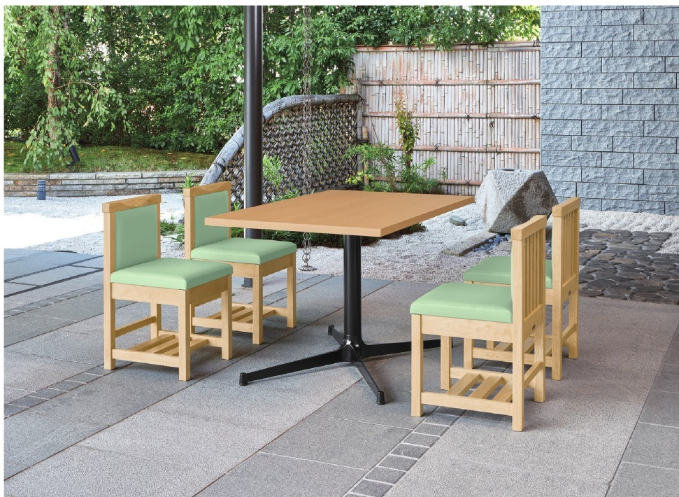
脚部 4318 天板 9305 HX・太子Nテーブル W1200 × D750 × H700mm【P112 記載】 張地/クレンズII L-6676 (A)