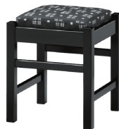
1393-1740 弥山 B 椅子 張地: カスリレザー (既製品)