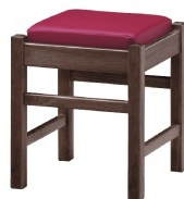
1193-1739 弥山 D 椅子 張地: 赤レザー (既製品)