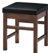
1195-1841 天竜 D 椅子 張地: 黒レザー (既製品)