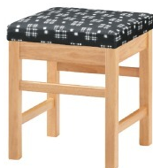
1095-1840 天竜 N 椅子 張地: カスリレザー (既製品)