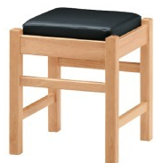
1093-1738 弥山 N 椅子 張地: 黒レザー (既製品)