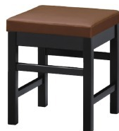
1395-1839 天竜 B 椅子 張地: 茶レザー (既製品)