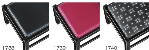
1738 黒レザー (既製品) 張地: オールマイティ L-6562 1739 赤レザー (既製品) 張地: オールマイティ L-6595 1740 カスリレザー (既製品) 張地: カスリ