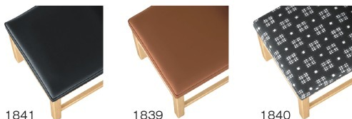
1841 黒レザー (既製品) 張地: クレンスII L-6702 1839 茶レザー (既製品) 張地: クレンスII L-6700 1840 カスリレザー (既製品) 張地: カスリ