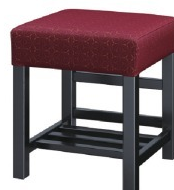
1354 宮滝 B 椅子 張地: 麻葉繫 UP-5473 (D)