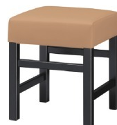
1233 保津 B 椅子 張地: クレンズII L-6697 (A)