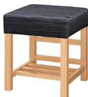
1054 宮滝 N 椅子 張地: デコア L-6321 (C)