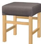
1033 保津 N 椅子 張地: マニエラ L-6353 (C)