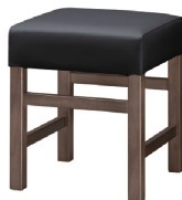
1133 保津 D 椅子 張地: クレンズII L6702 (A)