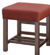
1154 宮滝 D 椅子 張地: デコア L-6315 (C)