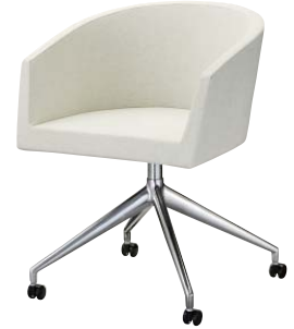
インクイスE (キャスター付) 21623-A D/レザー・フロワ1 脚部：ベースアルミ合金 (キャスター付) 座厚：55 受座：170角150ピッチ ※受座に上下・回転機能は、 付属しません。