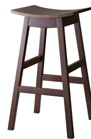
ジミースタンドBR 11928-E 合板シート ¥36,800