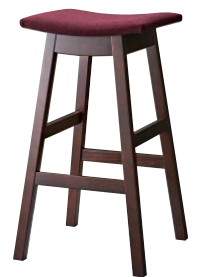
ジミースタンドBR 11931-E F/布・ラット2010