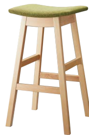
ジミースタンドNA 11930-E ランク外/布・ベス/AT-9262 特別価格 ¥36,400