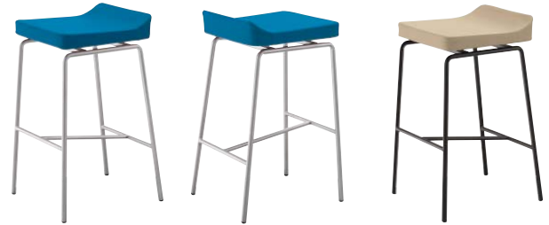
コンセスタンドA-AL 21378-E E/布・パルパ025